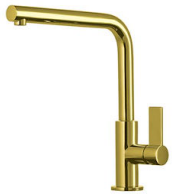
Miscelatore Omega Gold 8497 700