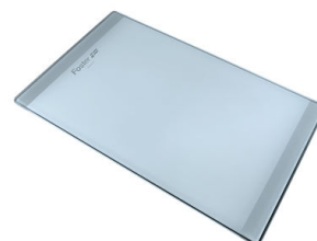
Tagliere in cristallo 8631 300